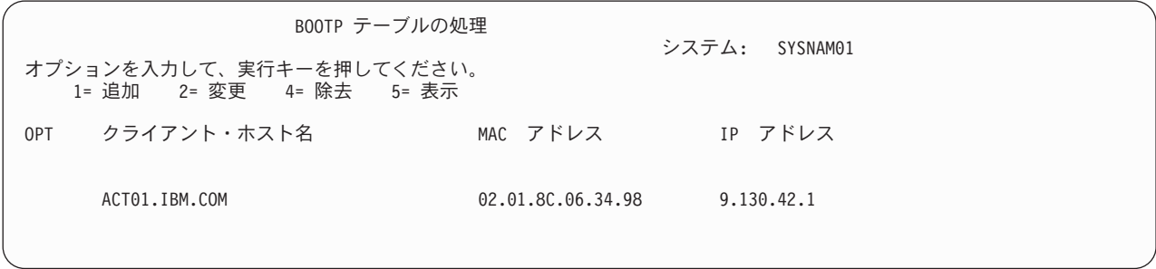
図 3. BOOTP テーブルの処理 (WRKBPTBL)