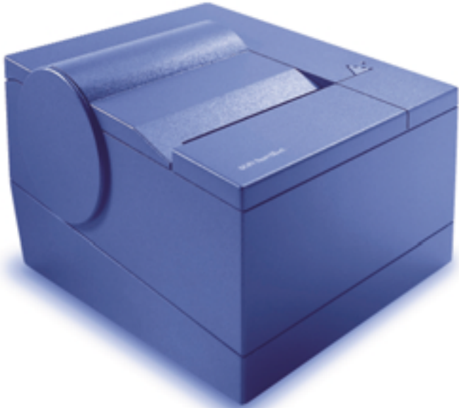
IBM SureMark 프린터 TF6/TF7 모델