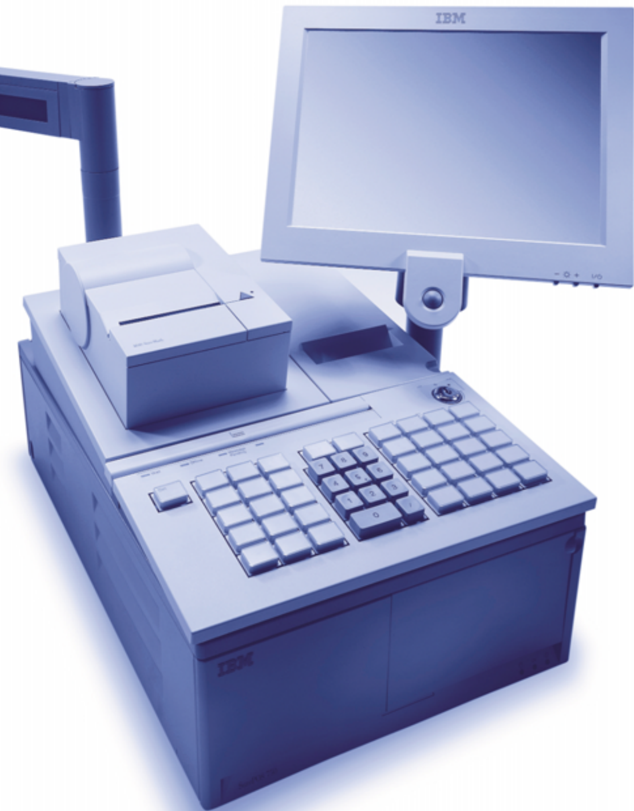
IBM SurePOS 750과 통합된 IBM SureMark 프린터 TM6 / TM7 모델