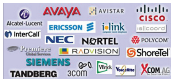
Figura 1. Quadro riassuntivo dei Business Partner IBM che offrono estensioni UC per il software Lotus Sametime relativo ad aprile 2008.

Per garantire un supporto concreto alla propria strategia, IBM prevede di continuare a investire concretamente il proprio tempo per creare un portafoglio consistente di Business Partner in grado di offrire accessori per la telefonia, audio e video integrati (ad esempio, telefoni VoIP, videocamere, altri dispositivi SIP), compatibilità con gli standard e gestione delle funzionalità di messaggistica immediata nonché VAR (Value-Added Reseller), VAD (Value-Added Distributor), integratori di sistemi e una vasta gamma di ISV (Independent Software Vendor) in grado di offrire applicazioni per mercati verticali e orizzontali (ad esempio, software per la gestione di flussi di lavoro, ERP (Enterprise Resource Planning), PLM (Product Lifecycle Management), software per il settore sanitario). IBM dispone attualmente di oltre 100 Business Partner in grado di creare soluzioni per il software Lotus Sametime. Molti di questi sono gratuiti nel catalogo plugin di Lotus Sametime.