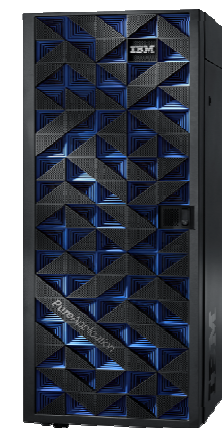
96 core and above