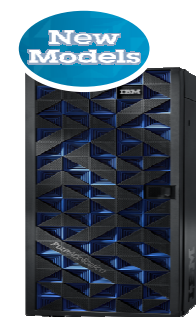
32 & 64 core options