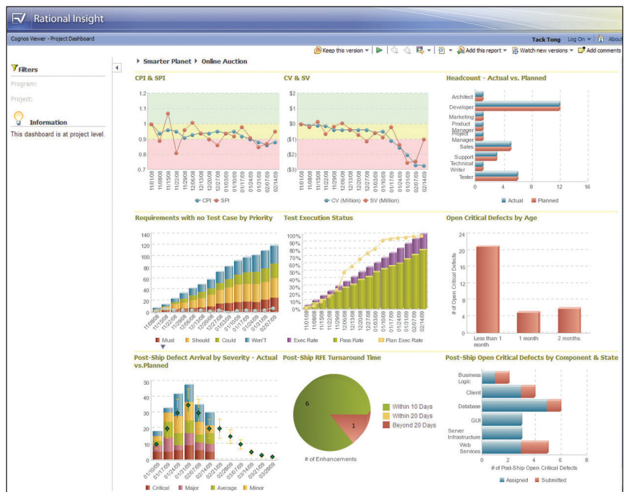
Abbildung 1: Rational Insight automatisiert Messung und Analyse tatsächlicher On Demand Daten zur Verbesserung der Entwicklung und Bereitstellung von Software und Systemen.

Da diese wichtigen Information per Mausklick zur Verfügung stehen, können umgehend Maßnahmen zur Fehlerbehebung eingeleitet, die Gründe für verpasste Termine analysiert, realistische Projekterwartungen festgelegt und fundiertere Entscheidungen getroffen werden.