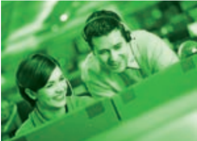
Eine IBM Lösung für die Verwaltung von Unternehmens-Content kann den Unterschied bedeuten zwischen angemessenem und herausragendem Customer Service.