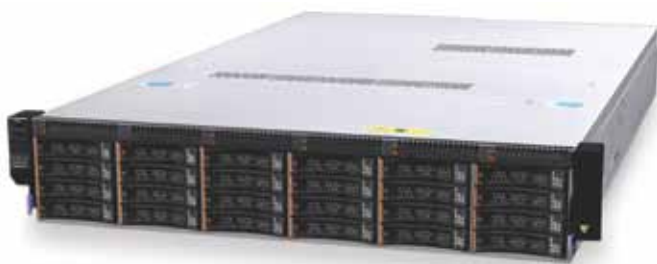
Das Smart Analytics System 5710 umfasst bewährte IBM Software, einen energieeffizienten IBM System x3630 M3 Server und IBM Speicher.

Mit dem Smart Analytics System 5710 steht Ihnen ein System zur Verfügung, das Ihre Daten analysiert, sie in einer verwendbaren Form zusammenstellt und bedarfsgerecht verfügbar macht. Sie können somit bei Bedarf auf Ihrem Laptop oder Tablet-PC eine Vielzahl von BI-Berichten anzeigen (in leicht verständlichen Scorecards und Dashboards). Dadurch erhalten Sie umfangreiche Erkenntnisse über die geschäftliche Leistung und Kundentrends. Mithilfe aktueller und relevanter Informationen können Sie bessere und schnellere Entscheidungen treffen. Ergreifen Sie jetzt die richtigen Maßnahmen, um die Geschäftsergebnisse zu verbessern.