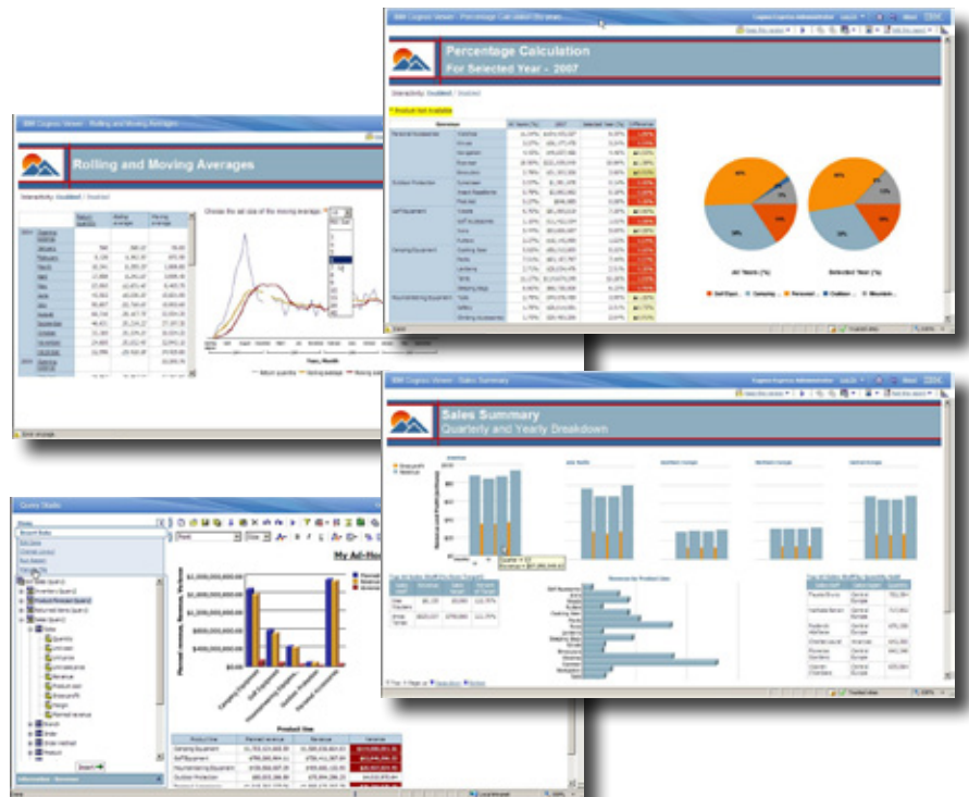
Une interface intuitive, très facile à utiliser permet d'accéder en libre-service à tous les rapports et analyses, de savoir précisément où vous en êtes et de comprendre les leviers de la performance.

Les utilisateurs souhaitent aussi parfois analyser d'autres données et créer de nouvelles dimensions. IBM Cognos Express Advisor permet de travailler librement sur les données brutes afin de combiner des informations à la volée puis d'analyser les résultats de manière itérative et non-structurée. La complexité technique de la modélisation des données et du traitement OLAP en