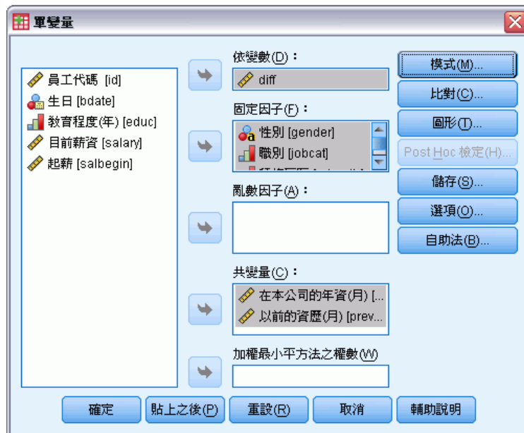
圖表 3-12 「GLM 單變量」主對話方塊