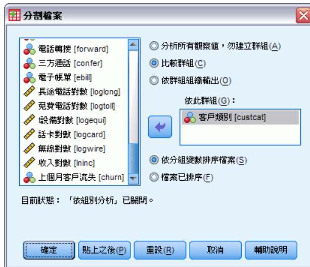
圖表 3-1 「分割檔案」對話方塊