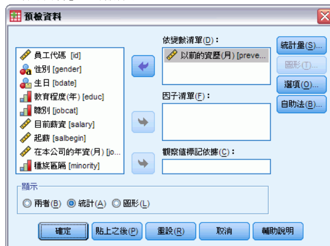
圖表 3-8 「預檢資料」主對話方塊