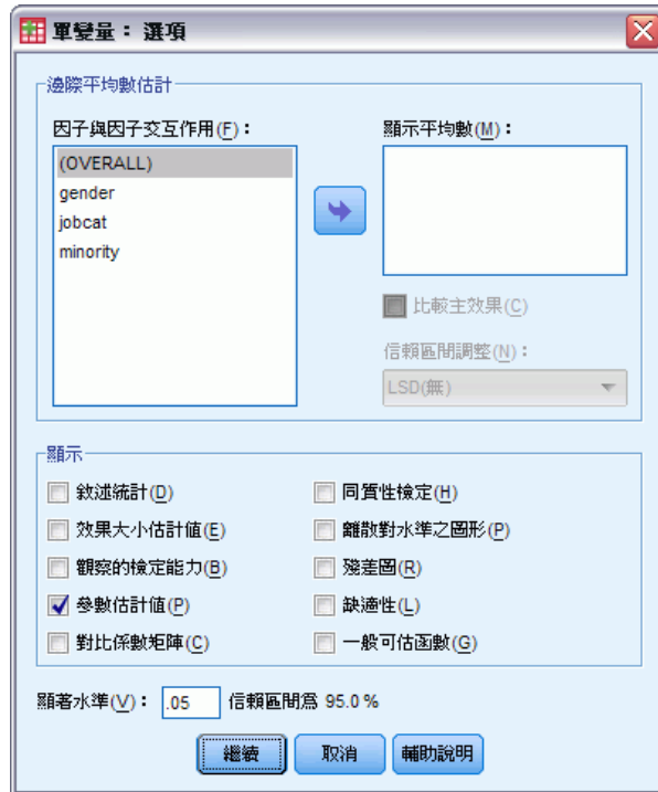
圖表 3-16 「選項」對話方塊