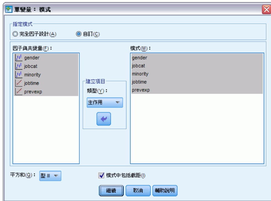
圖表 3-13 「模式」對話方塊