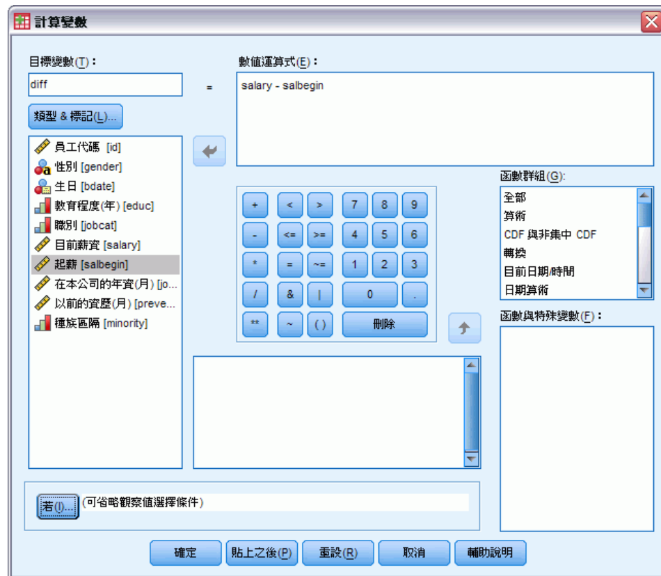
圖表 3-11 「計算變數」對話方塊