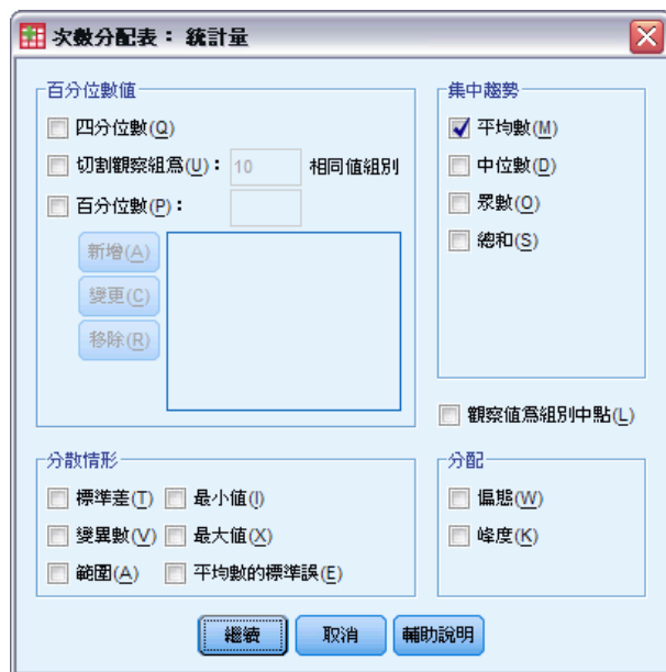
圖表 3-3 「統計量」對話方塊