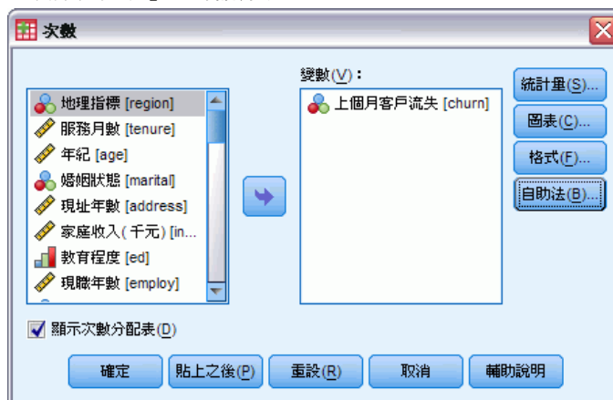
圖表 3-2 「次數分配表」主對話方塊