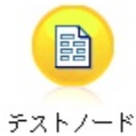
Rysunek 4. Etykieta węzła zawierająca znaki spoza zestawu ASCII, wyświetlana prawidłowo

Spowoduje to utworzenie łańcucha Unicode i prawidłowe wyświetlenie etykiety.