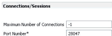
図 2-2 接続/セッションの設定

接続の最大数: (max_sessions) 一度に接続できる最大ユーザー数。-1 を設定すると、制限はありません。