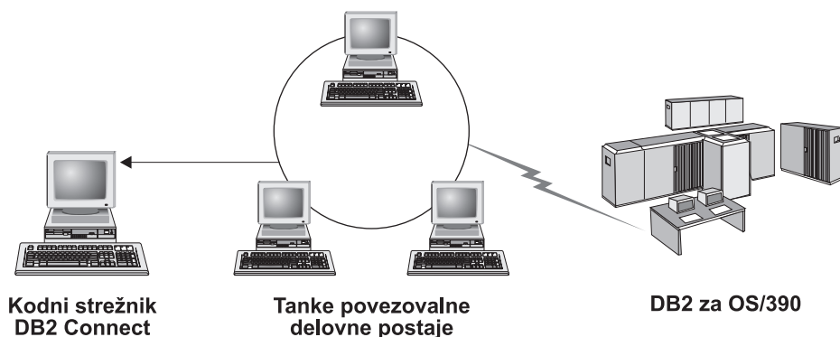
Slika 2. Značilna topologija tankega odjemalca, ki uporablja DB2 Connect Personal Edition