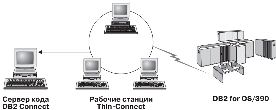
Рисунок 2. Типичная топология минимального клиента при использовании DB2 Connect Personal Edition

Используйте этот метод минимального клиента при установке в случае, когда клиентским рабочим станциям требуется только эпизодический доступ к базе данных или когда было бы затруднительно установить Клиент IBM data server на каждой клиентской рабочей станции. Если вы реализуете такую среду, снижаются требования к объему дискового пространства на каждой рабочей станции, а программный код нужно устанавливать, обновлять и перенастраивать только на одном компьютере (на сервере программного кода).