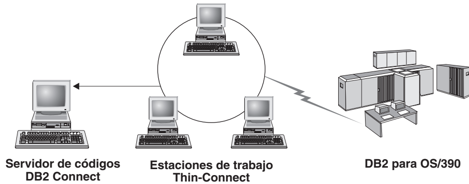
Figura 2. Topología de cliente Thin habitual que utiliza DB2 Connect Personal Edition

Utilice el método de instalación de cliente Thin para instalar un cliente cuando las estaciones de trabajo cliente sólo necesiten un acceso ocasional a una base de datos o cuando sea difícil configurar el cliente de servidor de datos de IBM en cada estación de trabajo cliente. Si implementa este tipo de entorno, los requisitos de espacio de disco para cada estación de trabajo se reducen y sólo es necesario instalar, actualizar o migrar el código en una máquina: el servidor de códigos.