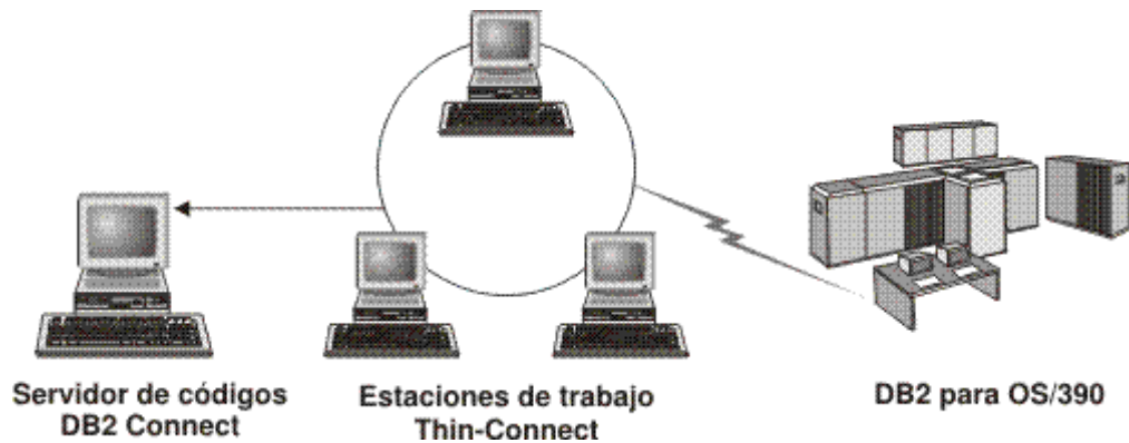
Figura 2. Topología de cliente Thin habitual que utiliza DB2 Connect Personal Edition

Utilice el método de instalación de cliente Thin para instalar un cliente cuando las estaciones de trabajo cliente sólo necesiten un acceso ocasional a una base de datos o cuando sea difícil configurar el cliente IBM Data Server en cada estación de trabajo cliente. Si implementa este tipo de entorno, los requisitos de espacio de disco para cada estación de trabajo se reducen y sólo es necesario instalar, actualizar o migrar el código en una máquina: el servidor de códigos.