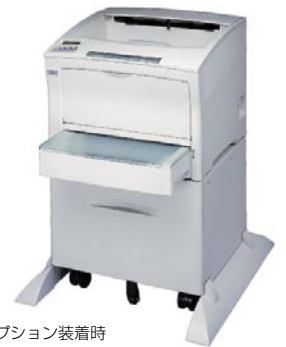
※オプション装着時

さまざまなシンボル印刷に対応し、SCM (Supply Chain Management) プリンティング・ソリューションを構築します。1次元シンボル (バーコード)、新郵便番号制カスタマバーコード、さらに次世代シンボルである2次元シンボル (QRコード、PDF417) 対応機能も加わりました。特別な生成プログラムなしでPCからの印刷はもちろん、ホスト・プログラムの指示による印刷も可能です。