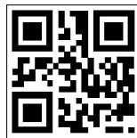
2次元シンボル (QRコード)